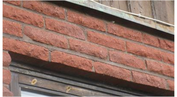
Fogsläpp ovan ett fönster.