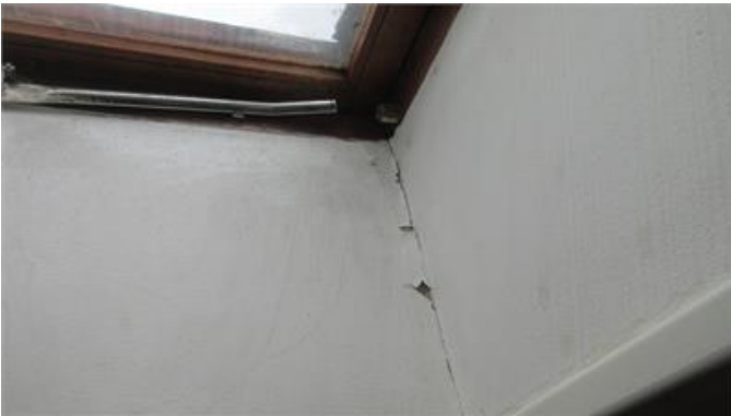
Missfärgningar/formförändringar i anslutning till takfönster.