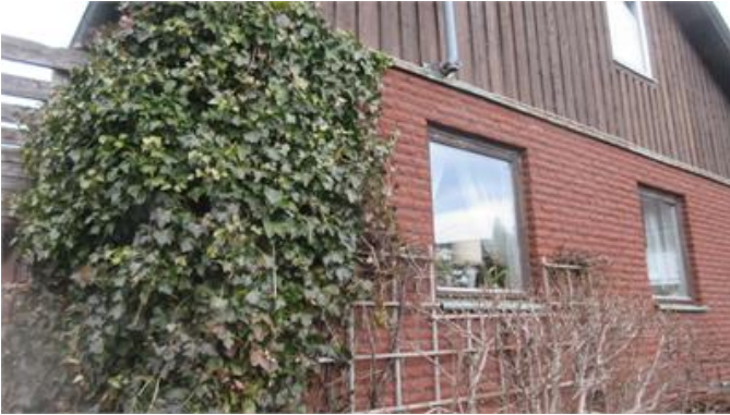
Vegetation intill husliv.