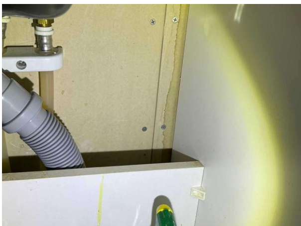
Bild 7: Invändigt, Entréplan, fuktros noteras på väggen i diskbänksskåpet ...