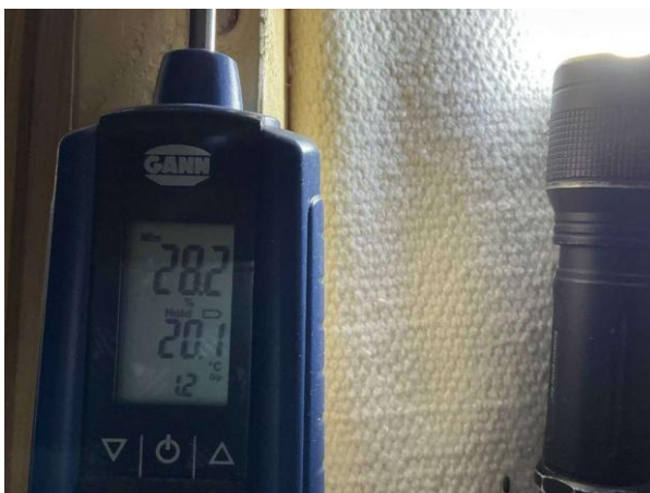
Bild 2: - Utvändigt, Vind, Fuktkontroll utförd under gränsvärde se bilaga 4