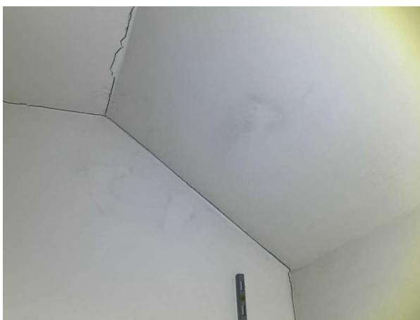
Bild 6: Invändigt, Allmänt, Rörelsesprickor noteras i tak/väggvinklar...