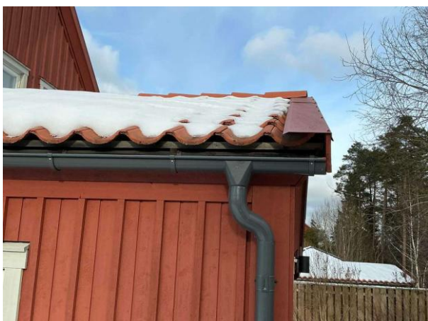
Bild 5: - Utvändigt, Yttertak, Taket är snötäckt och inte besiktningsbart, utgår ur besiktningen