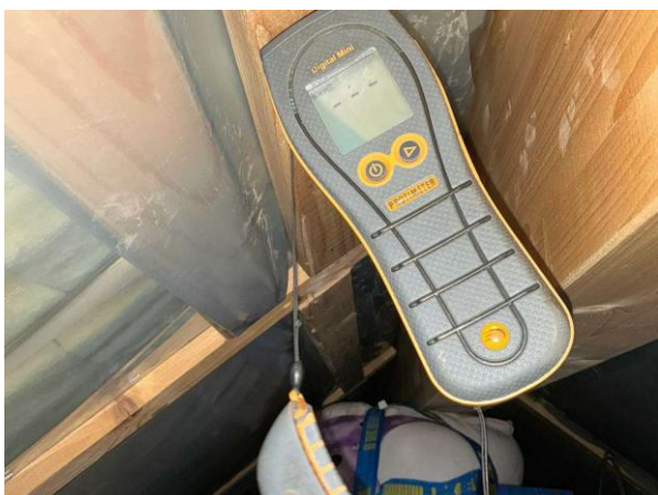
Bild 3: - Utvändigt, Vind, Fuktkontroll utförd under gränsvärde se bilaga 4